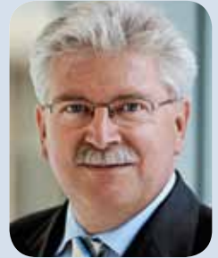
Martin Zeil Bayerischer Staatsminister

Ich wünsche dem Forum einen erfolgreichen Verlauf und lade alle Interessierten herzlich zur Teilnahme ein.